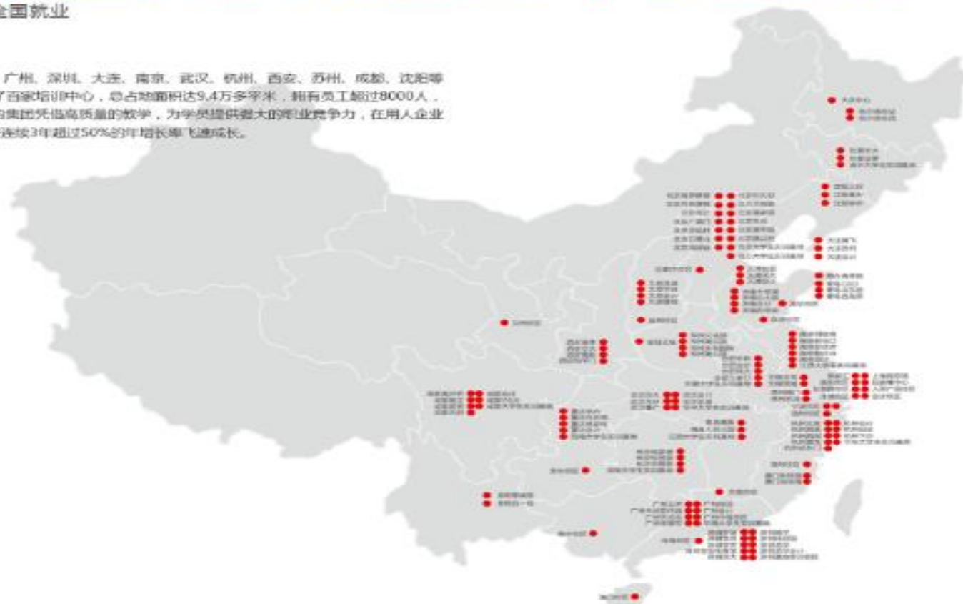
达内神州科技集团·实训中心全国分布图

目前达内在北京、上海、广州、深圳、大连、南京、武汉、杭州、西安、苏州、成都、沈阳等54个大、中城市，成立了百家培训中心，总占地面积达9.4万多平米，拥有员工超过8000人，年培训量达10万人。达内集团凭借高质量的教学，为学员提供强大的就业竞争力，在用人企业中树立了良好的口碑，并连续3年超过50%的年增长率飞速成长。